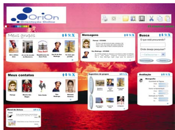
Figura 2. Personalização da Área Individual de Trabalho e Aprendizagem

A partir do layout padrão (Figura 1) um usuário poderá fazer alterações diversas como, por exemplo, ocultar a janela funcional de informações pessoais, mudar a disposição das demais janelas, configurar cores e fontes e inserir uma figura como plano de fundo (Figura 2).