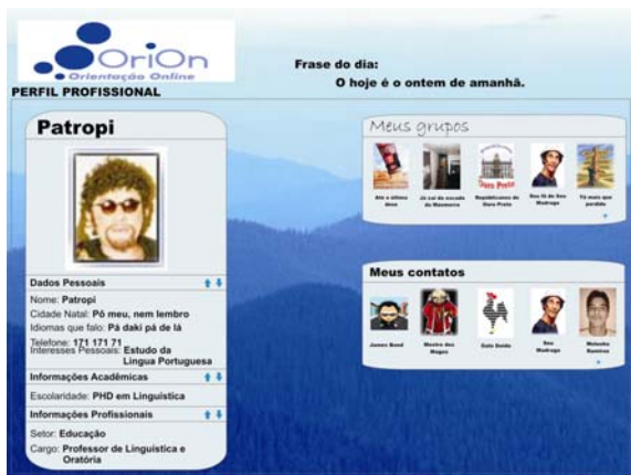
Figura 3. Perfil Profissional de um usuário do OriOnGroups.

Diversos perfis podem ser criados, configurando as informações e layout, de acordo com o contexto desejado, bem como níveis de privacidade em cada perfil. Para permitir a construção destas diversas 'identidades' os usuários terão disponíveis maneiras de classificar os usuários em grupos e configurar o(s) perfil(is) visível(is) a cada grupo (Figura 4).